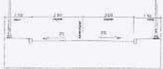
SECCION TIPO VIVIENDA INTERIOR